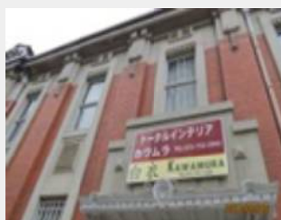
旧加島銀行 池田支店 国登録有形文化財 設計 辰野金吾(東京駅設計) NHK「あさが来た」広岡浅子